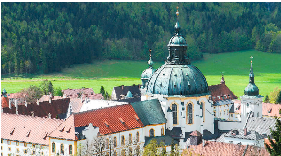
Das imposante Kloster Ettal aus der Vogelperspektive